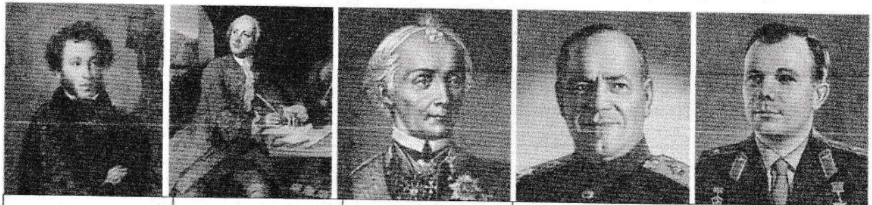
Пушкин Ломоносов Суворов Жуков Гагарин 35

2. Кого из исторических деятелей, прославивших Россию, вы узнали? Подпишите их фамилии. (1 балл за каждый правильный ответ, максимальный балл – 5).