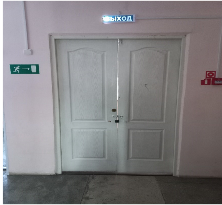
Фото 9. Путь эвакуации (7).