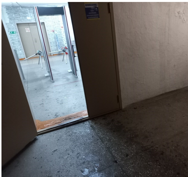
Фото 5. Тамбур (3)