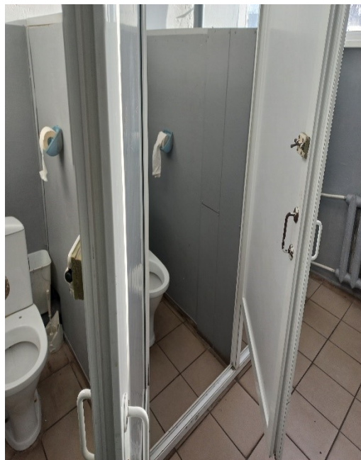
Фото 11. Туалетная комната (9).