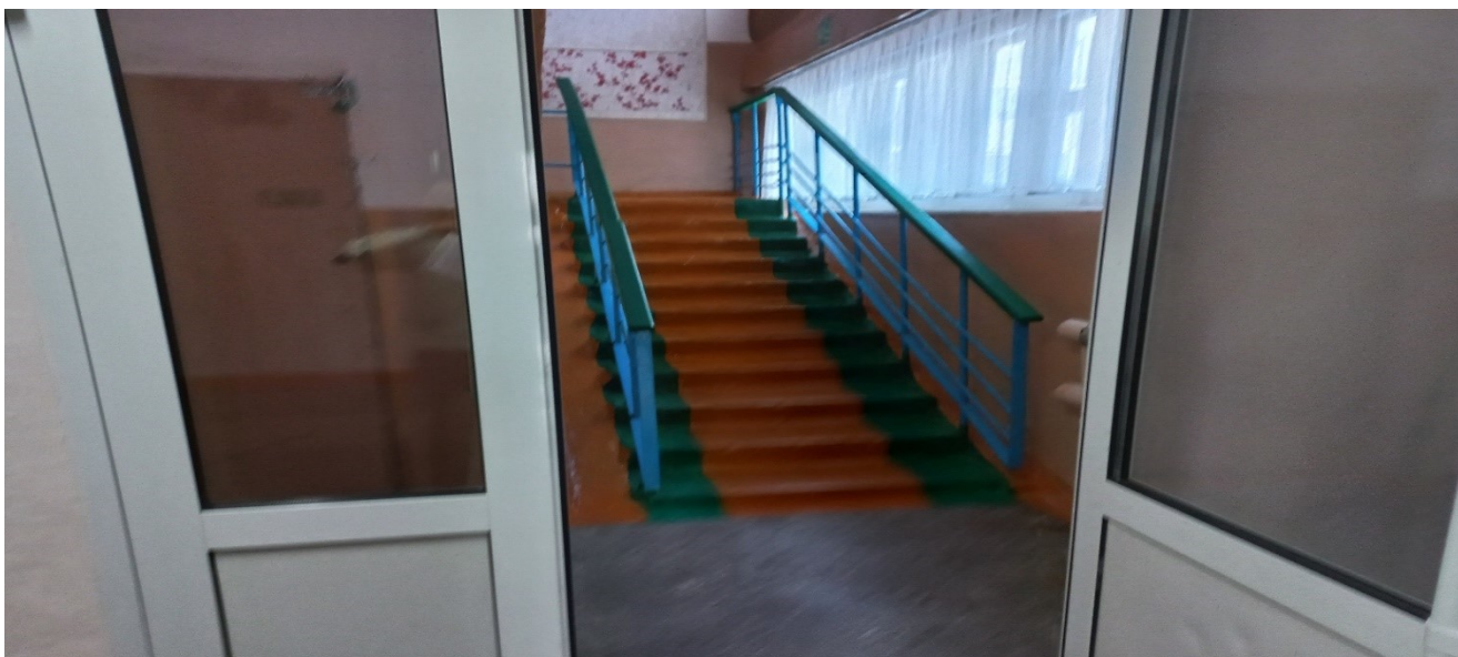
Фото 8. Дверь (6)