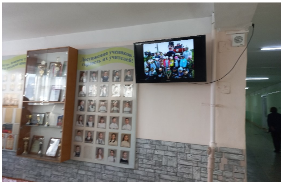
Фото13. Визуальные и аудио- средства. (11)