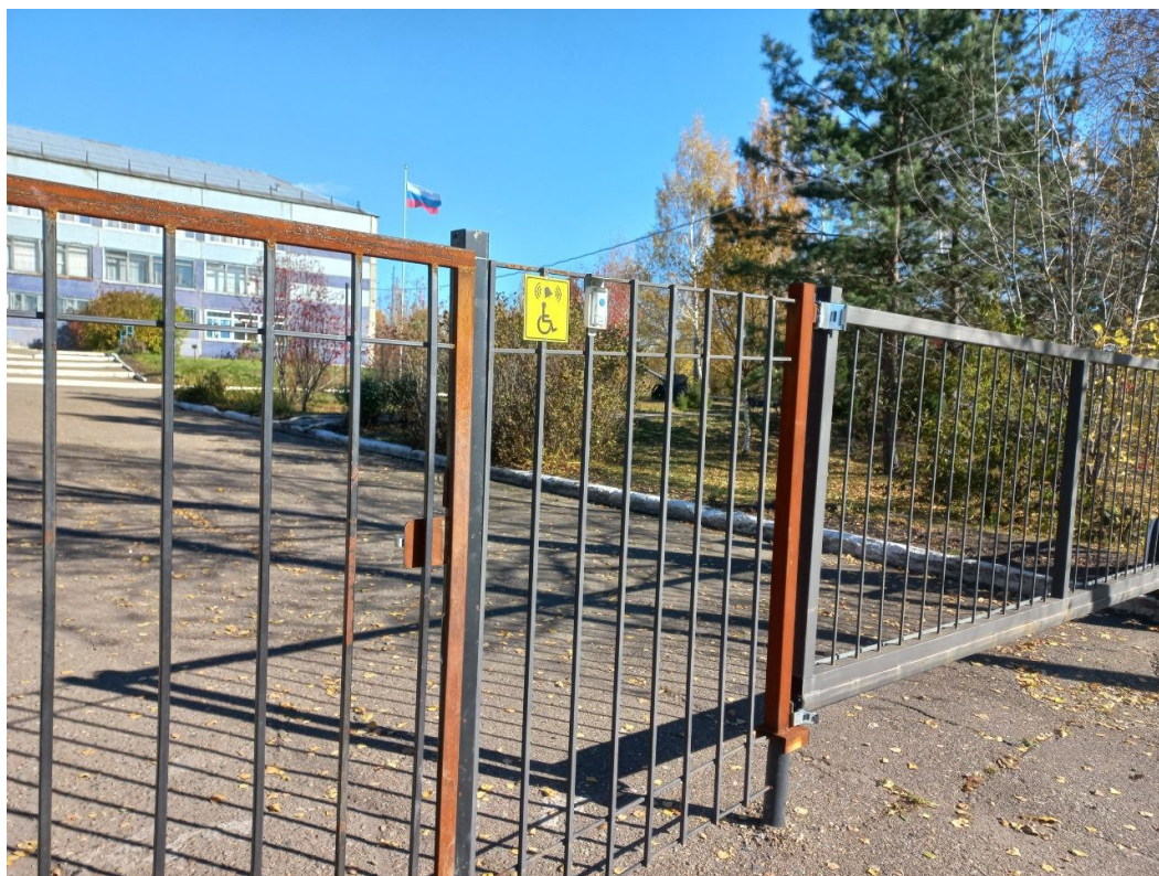
Фото1. Вход на территорию.