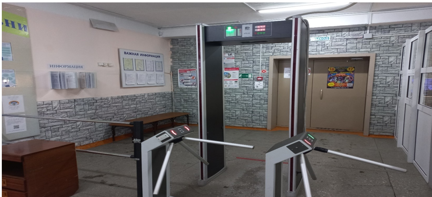
Фото 6. Вестибюль (коридор) (4)