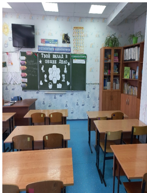
Фото 10. Кабинетная форма (8).