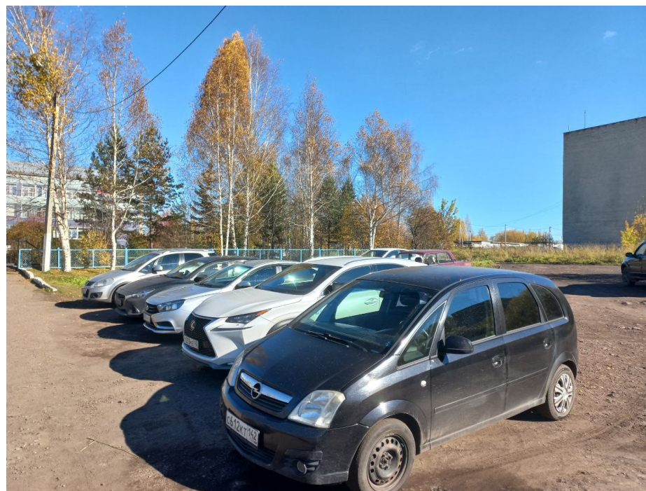
Фото2. Стоянка для авто.