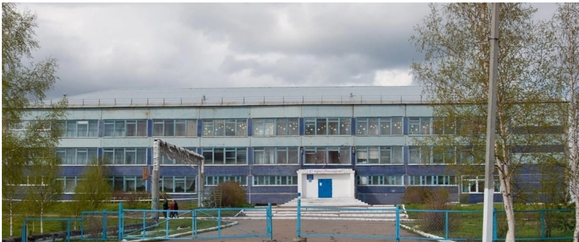
Фото 3. Лестница (1).