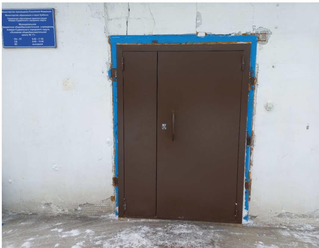
Фото 4. Дверь входная(2).