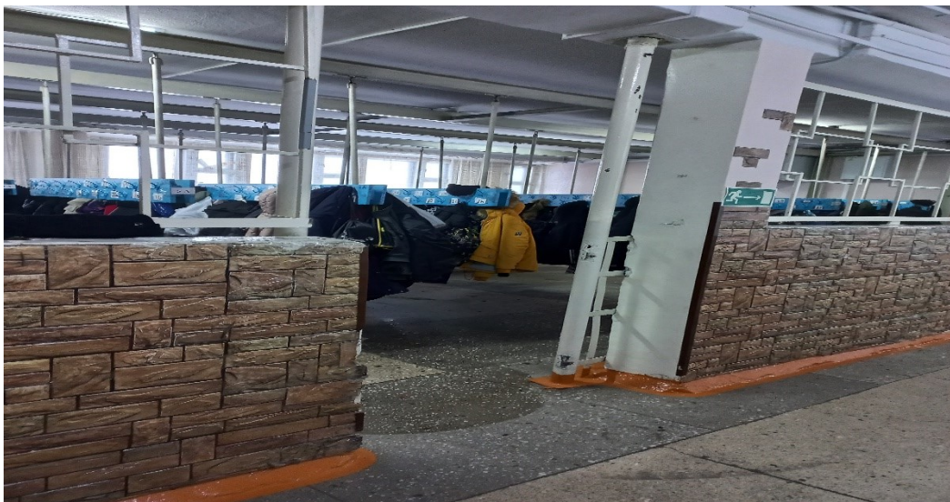
Фото 12. Гардероб (10).